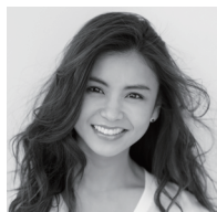
滝沢真規子（たきざわ まきこ）

岡山県生まれ。大学在学中より児童文学を書き始める。『ほたる館物語』で作家デビュー。『バッテリー』およびその続編で野間児童文芸賞、日本児童文学者協会賞、小学館児童出版文化賞を受賞。「ヴィヴァーチェ」シリーズ（角川書店）、「No.6」シリーズ（講談社）、『おいち不思議がたり』（PHP 研究所）、『花を呑む』（光文社）他著作多数。