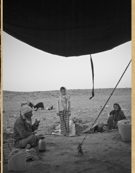
夕暮れ（イラン / 2009）