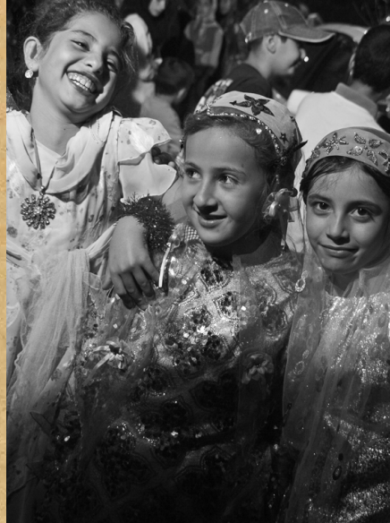
村の結婚式（イラン / 2009）